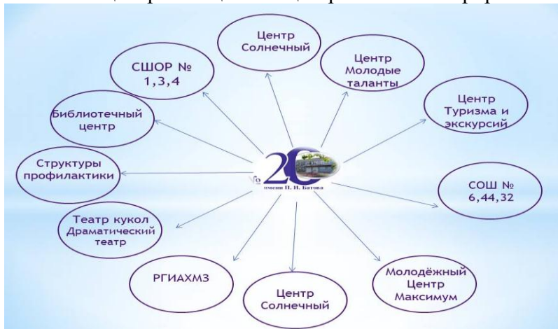
Рис. 1. Социальные партнёры

Отработан механизм социального партнерства с учреждениями, вовлеченными в организацию работы школы, и в результате плодотворного сотрудничества с ними школа стала основным центром социализации ребенка в микрорайоне.