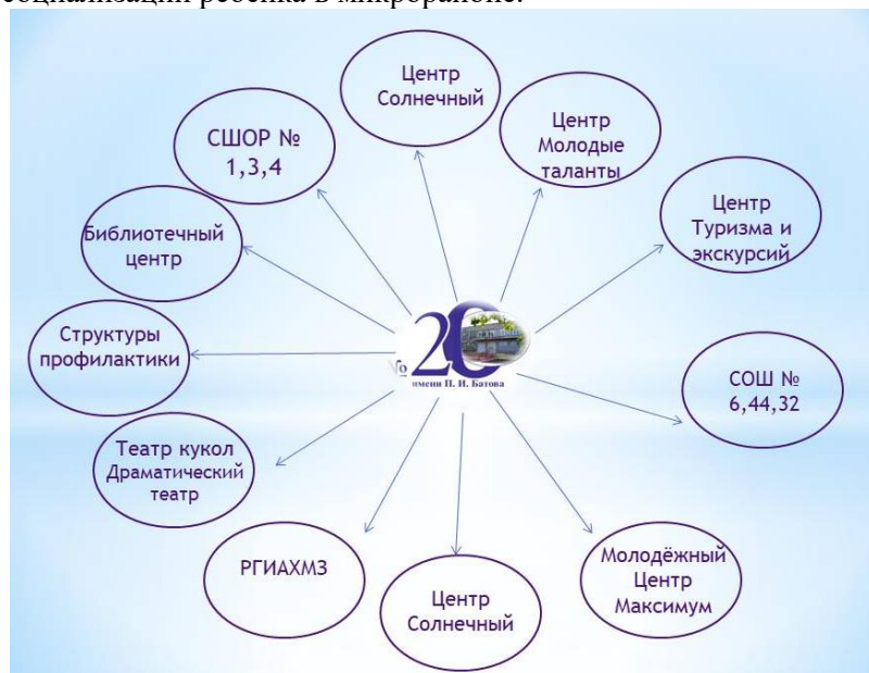
Рис. 1. Социальные партнёры

Отработан механизм социального партнерства с учреждениями, вовлеченными в организацию работы школы, и в результате плодотворного сотрудничества с ними школа стала основным центром социализации ребенка в микрорайоне.