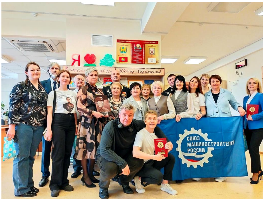
12-14. 04. 2024 г. Конференция СШ № 35 имени П.И.Батова г.Бобруйска

МОУ СОШ «ОБРАЗОВАТЕЛЬНЫЙ КОМПЛЕКС «ОМЕГА» ЦЕНТР ОБРАЗОВАНИЯ № 20 имени П.И.БАТОВА