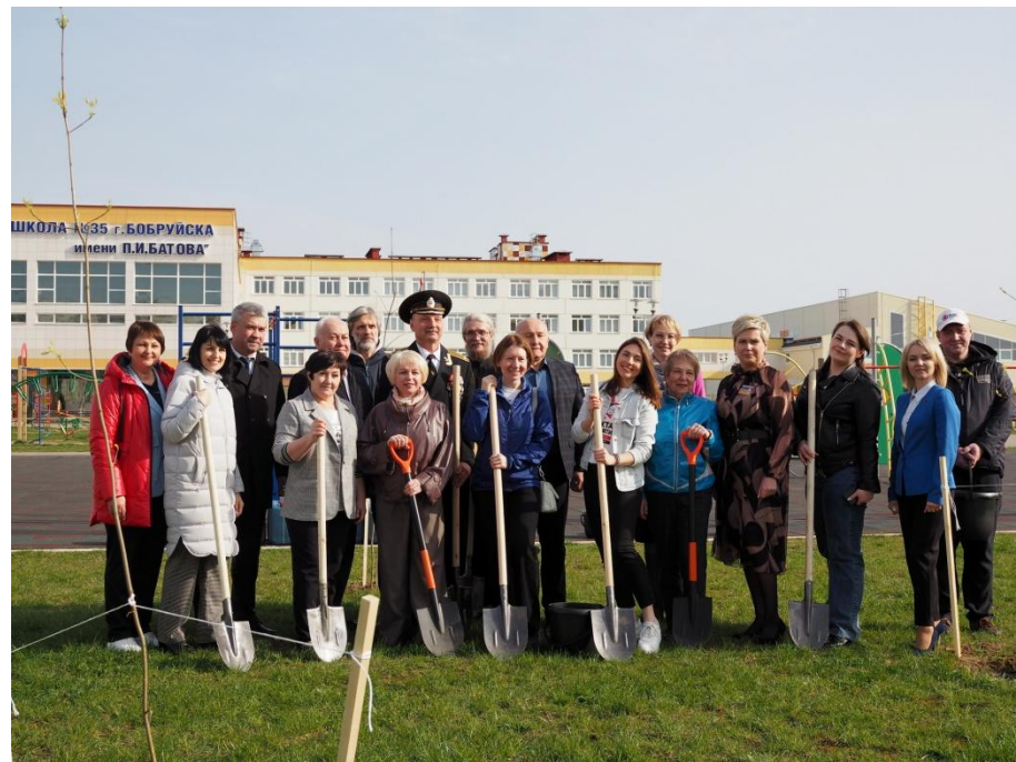
Сад «Дружбы» на территории СШ № 35 имени П.И.Батова г. Бобруйска